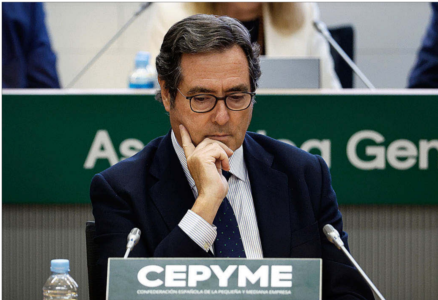
El presidente de la CEOE, Antonio Garamendi, clausura la Asamblea General de Cephyme.