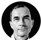
CARLOS FRESNEDA EVIAN

Los líderes europeos pidieron a Trump que se involucre personal-