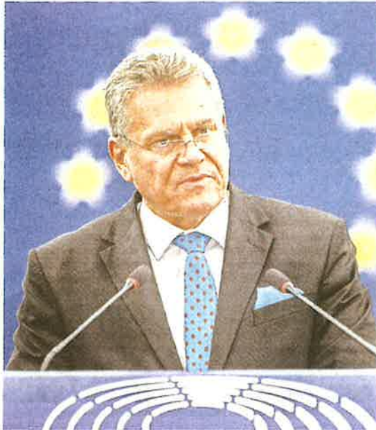
Maros Sefcovic, el lunes en Estrasburgo.

“Hubo retrasos que no tenían que ver con nosotros, también tenían que ver con Estados Unidos. Lo que ocurrió con Groenlandia, cuando se amenazó con aranceles. Y el Supremo estadounidense rechazó los aranceles [impuestos