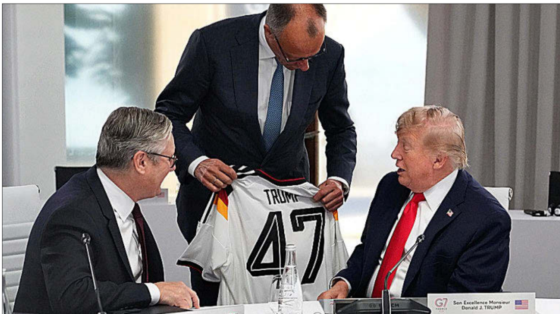
El canciller alemán Merz regala una camiseta de la selección alemana a Donald Trump, ayer, en Evian.