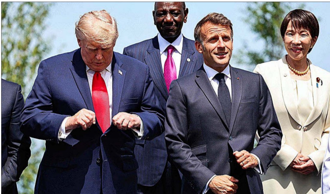
Foto de familia tras las reuniones del G-7, con Macron y Trump en el primer plano, ayer, en Evian.

Zelenski confirmó haber lanzado a Putin el órdago de un encuentro en el marco del G-7, «pero los rusos no quisieron». El presidente ucraniano expresó su esperanza en sellar un acuerdo de paz antes de fin de año para evitar que sus compatriotas soporten «otro invierno terrible».