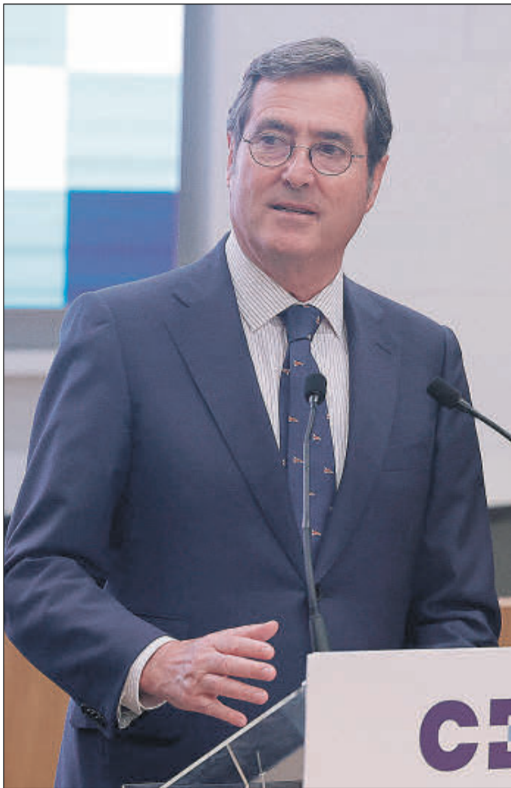
El presidente de CEOE, Antonio Garamendi.

En el mismo sentido se pronunció poco después el presidente de la patronal navarra CEN, Manuel Piquer. "Es un artículo determinante en el control de la baja médica" ase-