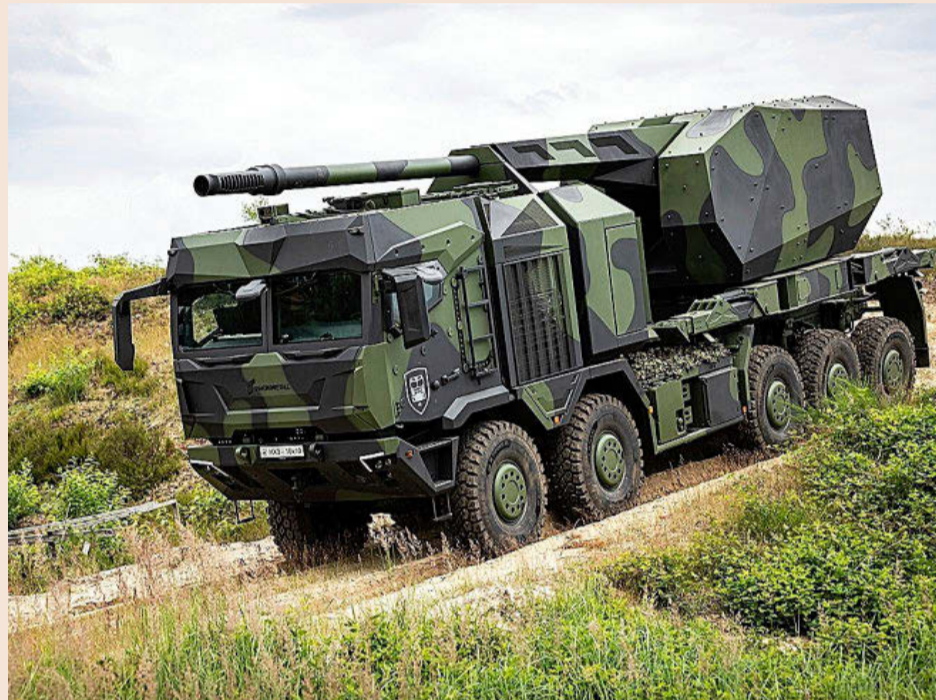
Vehículo blindado Howitzer de Rheinmetall.

Tanto a los programas de artillería como al del vehículo lanzapuentes también aspiraba Santa Bárbara Sistemas, propiedad de la estadouni-