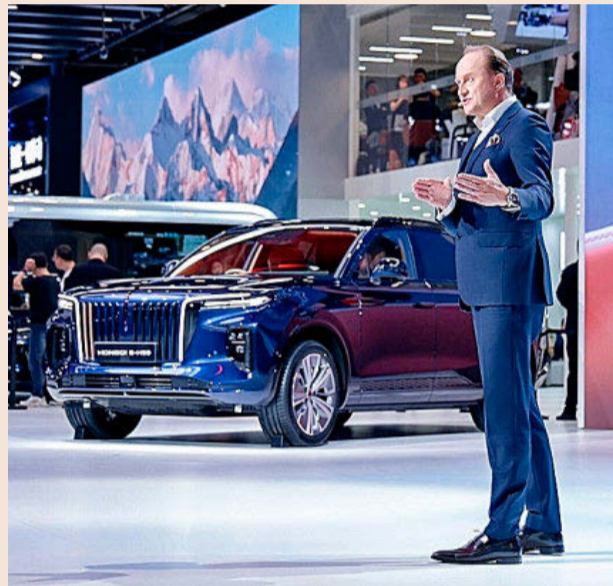
Una de las últimas novedades de Hongqi en el Salón de Pekín.

Stellantis y CATL están construyendo en Figueruelas, junto a la planta de montaje ya existente de Stellantis, una fábrica de baterías para vehículos eléctricos con una inver-