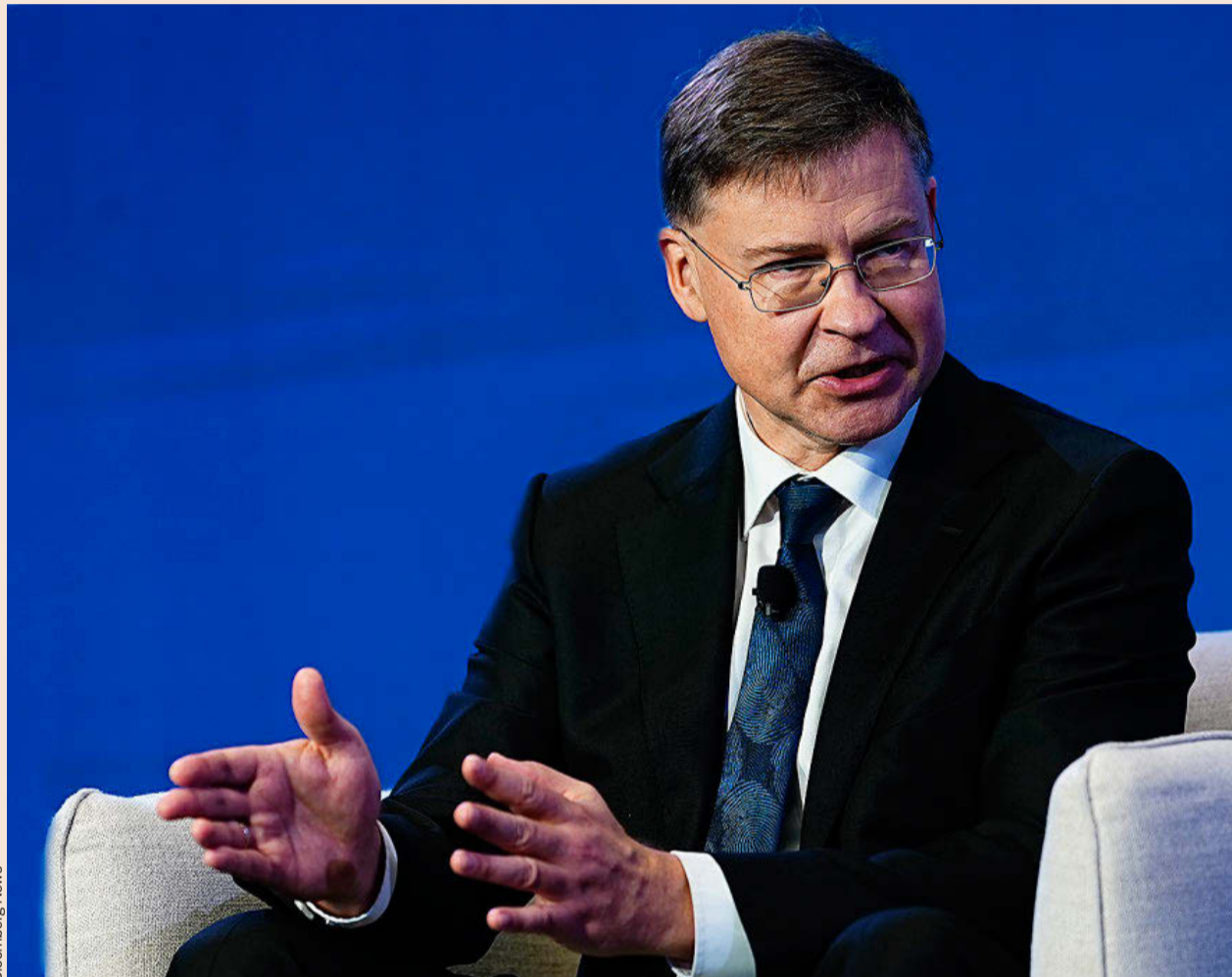
Valdis Dombrovskis, comisario de Economía y Productividad, Aplicación y Simplificación de la Comisión Europea.

Antes del conflicto en Oriente Medio, nuestra previsión de crecimiento para la UE era de aproximadamente un 1,5% para este año, lo que da una idea de la magnitud de la ralentización a la que nos enfrentamos. La volatilidad de los precios de los combustibles fósiles es la mayor amenaza para nuestra resiliencia económica y, por ello, reducir esta dependencia mediante el despliegue de renovables es clave para minimizar los impactos económicos negativos. – A la luz de esta desaceleración, varios países han solici-