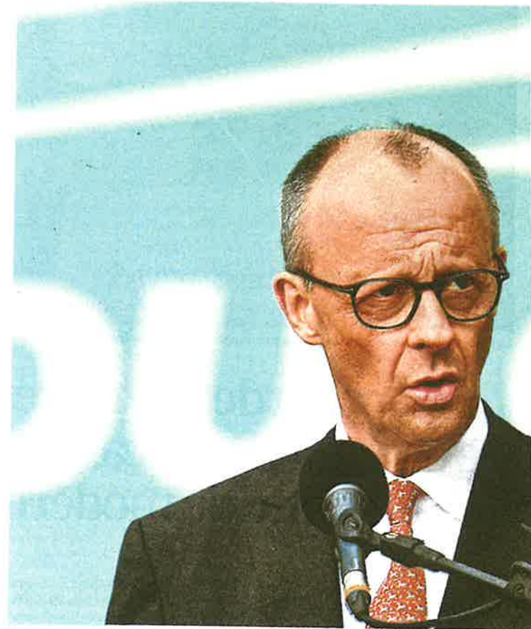
El canciller alemán Friedrich Merz sufre un bajísimo índice de popularidad.

El SPD también ha logrado aumentar significativamente el umbral para la exención del seguro hasta los 100.000 euros. Esto pretende evitar que demasiados trabajadores con altos ingresos abandonen la Seguridad Social y se cambien a un seguro médico privado. Aumentan además los copagos por medicamentos y hospitalización, además de cambios de reglas en la financiación que sin duda sobrecargarán a las Cajas del Seguro,