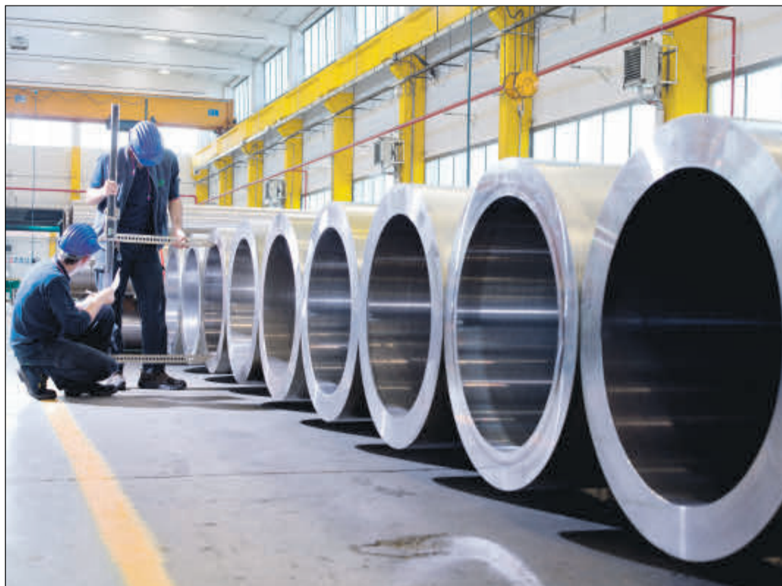
Tubos Reunidos no descarta la necesidad de presentar concurso de acreedores de forma voluntaria. EE

Sin embargo, el contrato de préstamo firmado con la SEPI a través del