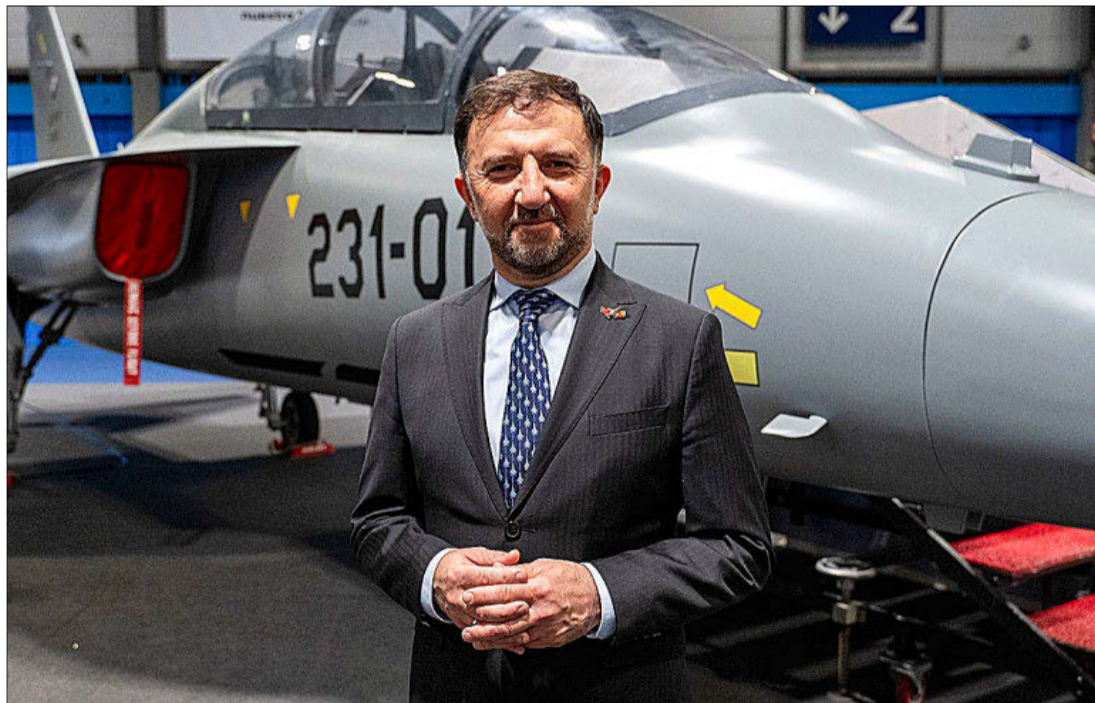
El presidente y consejero delegado de TUSAS, Mehmet Demiroğlu.

Ayer, en la sede de Getafe de Airbus, se escenificó la firma del contrato. El día anterior, Demiroğlu recibió a EL MUNDO en los diálogos EFE Defensa para explicar los avances del acuerdo. El plan es que los aviones lleguen montados desde Turquía y luego esa la UTE la que los españolice . «Permitirá que la industria de defensa española crezca», afirmó el pre-