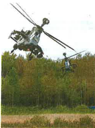
Helicópteros alemanes. Jgnacio Gil

«Ese aumento del gasto militar, del 2% en 2025, se inscribe dentro de un proceso. El incremento ya fue de un orden de magnitud similar en 2024. Alemania ahora gasta ahora en conjunto en defensa más del doble que en 2021, cuando rondaba los 50.000 millones. Hace diez años, Alemania seguía ocupando el noveno puesto entre los países con mayor gasto militar del mundo, mientras que hoy está en la parte más destacada de la lista», pone en contexto el director de Sipri, Karim Haggag.